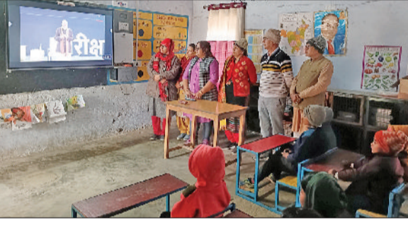
परीक्षा पर चर्चा कार्यक्रम को लेकर छात्रों में उत्साह