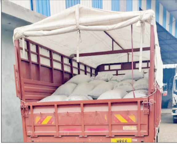
चरखीदादरी। मिल में सरसों से लदा कैंटर।

चौधरी के चिड़िया रोड स्थित एक ऑयल मिल पर सिम फ्लाइंग ने छापा मारा। छापेमारी में फ्लाइंग ने सरसों से भरा एक टैंकर पकड़ा। जिसमें 50 टन सरसों भरी हुई थी। टीम ने मार्केट फीस चोरी करने पर