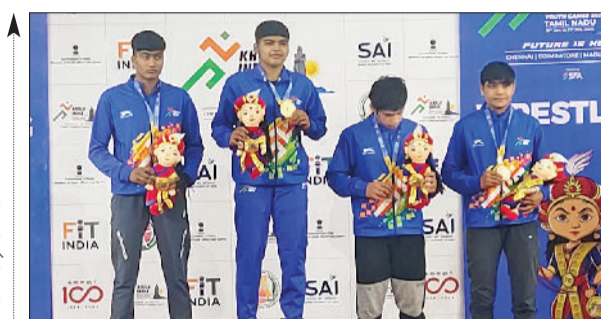
एमडी अकेडमी की खिलाड़ी ने जीता गोल्ड

नौजवान फौजी भर्ती होते थे, लेकिन भाजपा ने अगिनपथ योजना लागू करके हमारे नौजवानों से देश सेवा का यह अवसर ही छीन लिया, अब अगिनपथ योजना में पूरे हरियाणा से बमुश्किल 914 अगिनवीर ही भर्ती हो पाए, जिसमें से 75 प्रतिशत 4 साल बाद घर वापस आ जाएंगे, यही करीब 225 अगिनवीर ही पक्के होंगे। निजी क्षेत्र में निवेश नहीं आने के चलते नए रोजगार पैदा नहीं हो पा रहे हैं, इसीलिए हरियाणा आज बेरोजगारी में देश का नंबर वन राज्य बन चुका है। उन्होंने बताया कि प्रदेश की भर्तियों में 80 एसडीओ में से 78 बाहर के चयनित हुए।