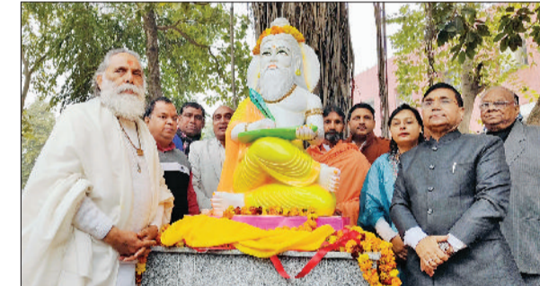
मिवानी। महर्षि वाल्मीकि की प्रतिमा का अनावरण करते हुए।